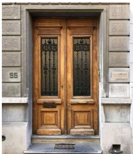
Le Canevas, Centre psychothérapeutique de jour