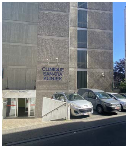
Sanatia, Hôpital psychiatrique