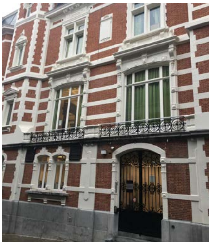
MSP, Maison de soins psychiatriques