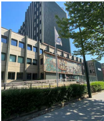
Valida, Centre de réadaptation neuro-locomoteur et gériatrique